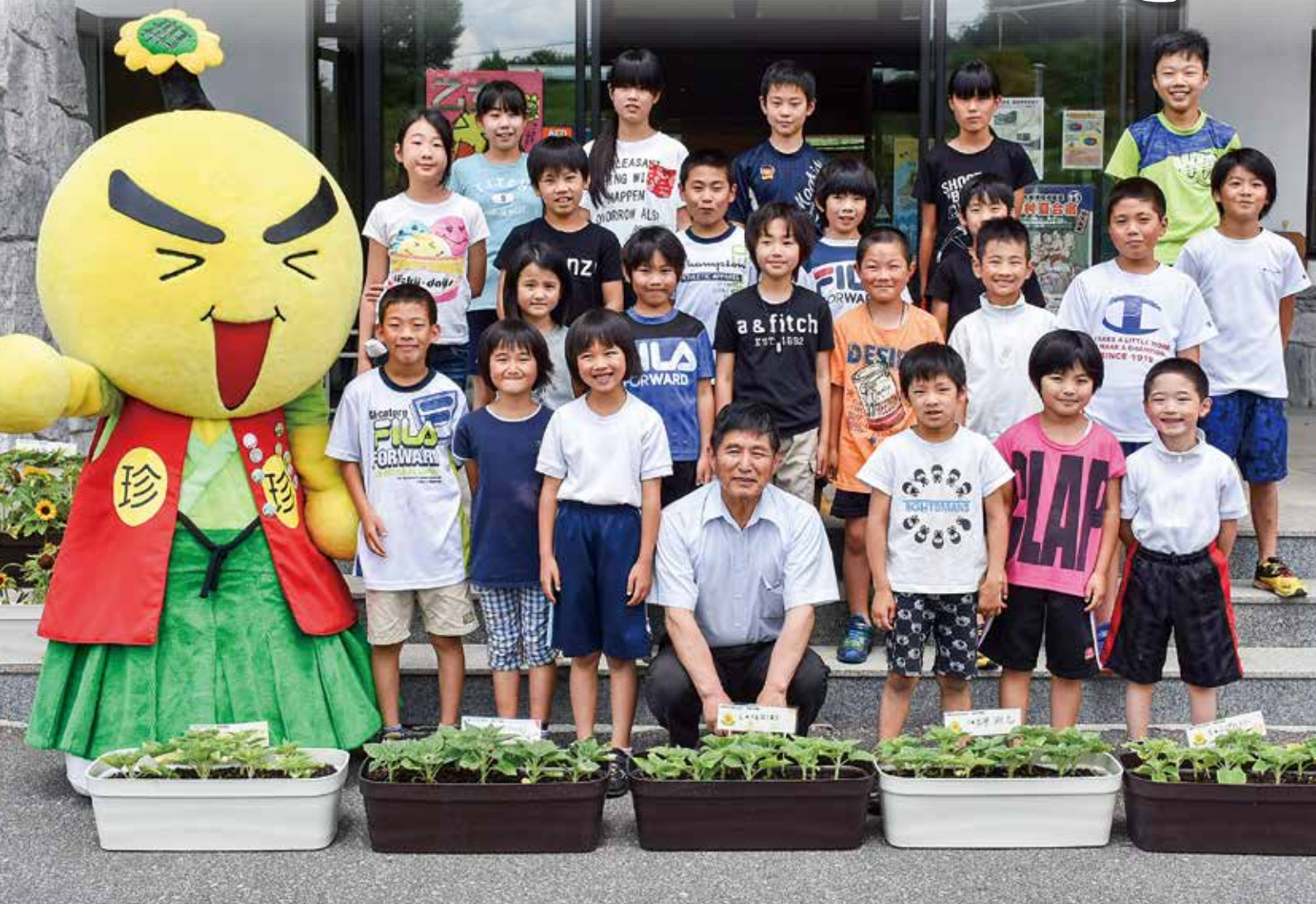
ひまわり咲かせ隊