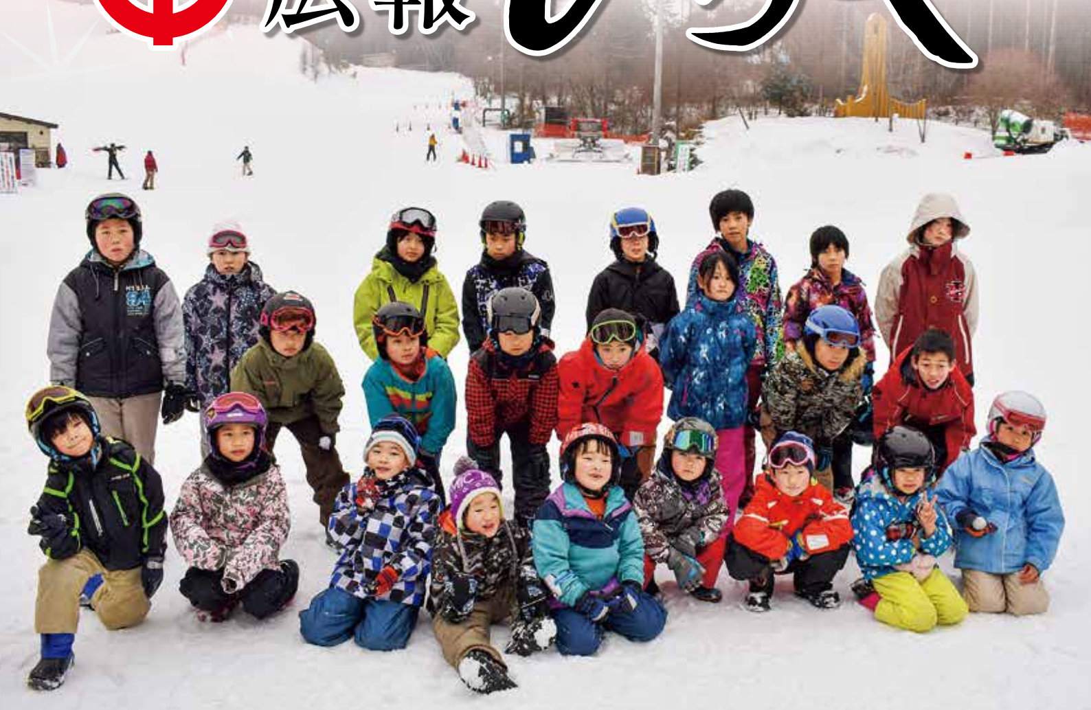
平谷小学校スキー教室