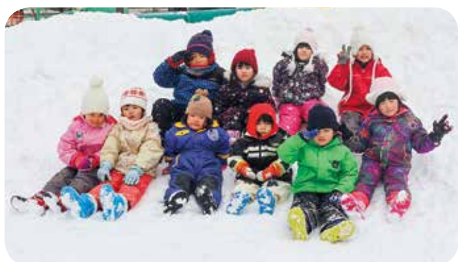
平谷村保育所ソリ遊び