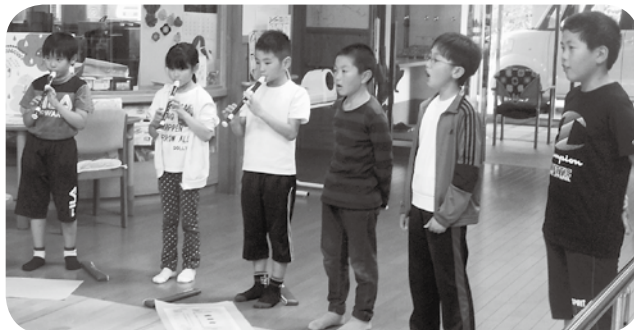
デイサービスのみなさんへ音楽会へのお誘い