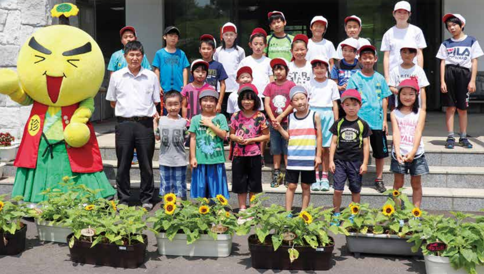
ひまわり咲かせ隊