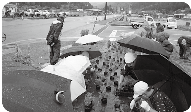
高嶺クラブのみなさんと花の苗植え