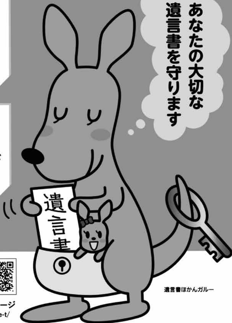
遺言書ほかんガルー