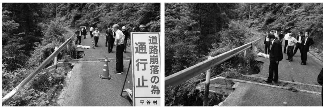
◆高嶺山林道 崩落現場視察 (定例会終了後)