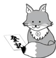
不動産登記推進イメージキャラクター「トウキツネ」

正当な理由がないのに、これらの申請を怠ったときは、10万円以下の過料の適用対象になります。