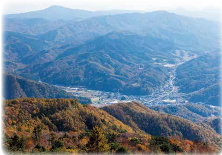
【フォレストパーク】高嶺山

だからなのか、ここに来ると村のこれからの姿というか将来を想い、“次”の何かをしなきゃいけない気持ちになりますね。