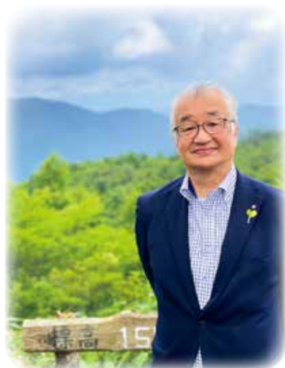
四方を臨む高嶺展望台にて

ここに来るとすべてが見渡せる 村の将来を想い、“次”の何かをしなきゃいけない気持ちになりますね